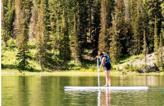
Tabla de remar parado

Aprobación del consejo local: sí se requiere